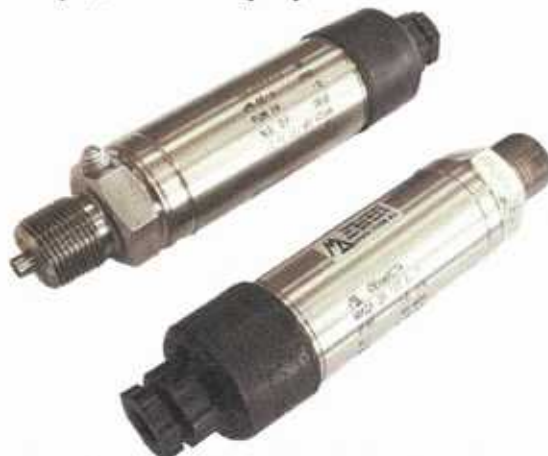
Рисунок 1 - Общий вид датчиков давления МИКА-13П

Общий вид датчиков представлен на рисунке 1.